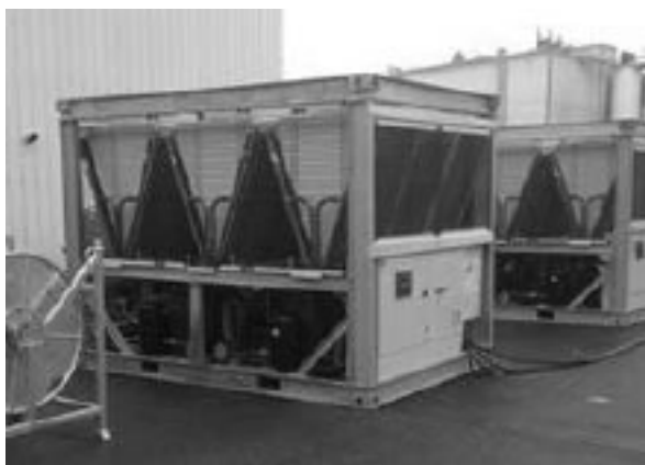
Fig. 3 Quando si deve riempire l'impianto con acqua, è possibile utilizzare il sistema del cliente oppure collegare un tubo esterno al chiller attraverso il punto di riempimento della pompa interna.