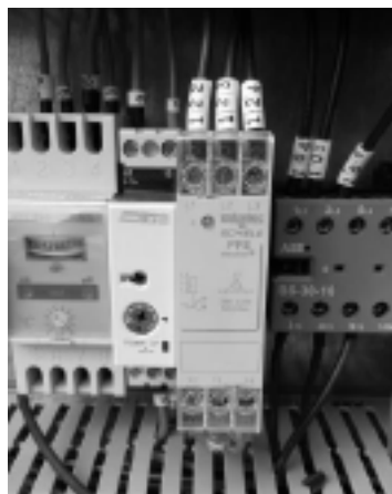
Fig. 5 Pannello di controllo. Le modalità di raffreddamento e bassa temperatura (VLT) possono essere selezionate tramite questo pannello.