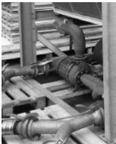
Fig. 3 Quando si deve riempire l'impianto con acqua, è possibile utilizzare il sistema del cliente oppure collegare un tubo esterno al chiller attraverso il punto di riempimento della pompa interna.